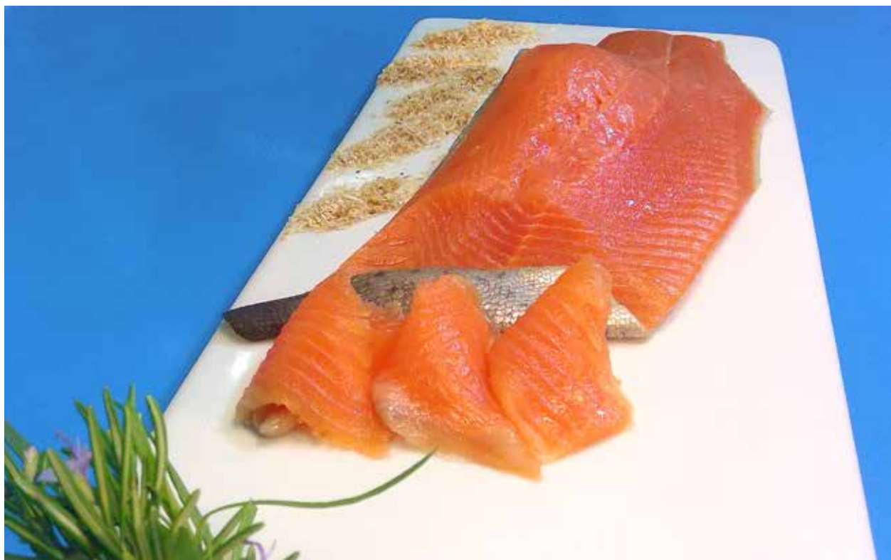
Abb. 2 | Pro Jahr werden in der Schweiz ca. 8000 Tonnen Fisch verarbeitet. Dabei handelt sich hauptsächlich um ganze ausgenommene Fische, gefrorene Produkte, Fischfilets und geräucherte Produkte.

Im Jahr 2016 wurden im Fischbereich am meisten Lachs (3333 Tonnen), Fischstäbchen (2716 Tonnen) und Crevetten (2498 Tonnen) verkauft. Bei Crevetten wurde eine Absatzeinbusse von 1,9 % gegenüber 2015 festgestellt. Hingegen konnten Lachs (+4,4 %) und Fischstäbchen (+4,8 %) weiter zulegen. Die grössten Verlierer waren Goldbutt (−8,3 %), Forellen (−4,6 %) und Fertig-Tiefkühl-Menüs (−3,4 %). Der Absatzrückgang bei den Forellen unterstreicht den Konsumtrend hin zu Salzwasserfischen (BLW 2017).