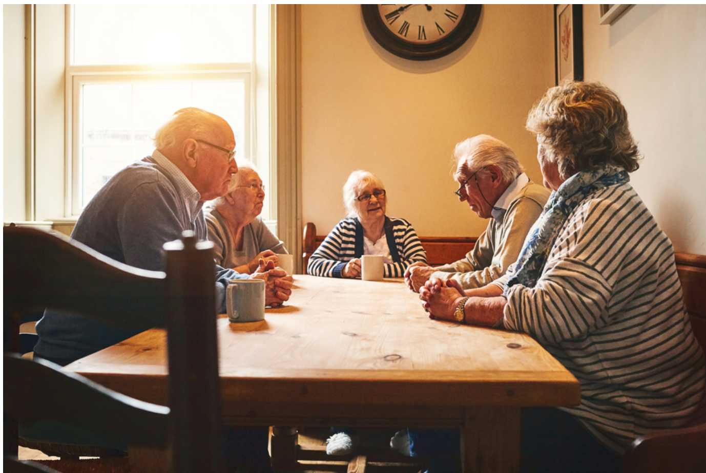
Zuhause alt werden: Was Wohnungsanbieter tun können