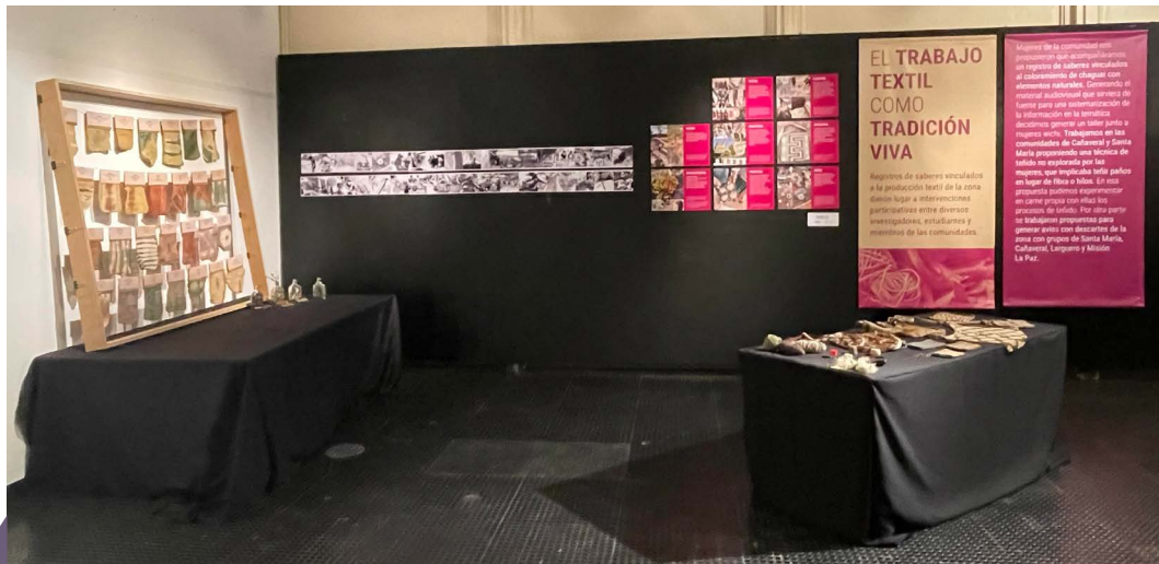
Figura 3. Representación de la temática textil y visualización de la guarda fotográfica en territorio. Foto: Agudín, 5 de junio 2023, Sala Baliero, FADU UBA.