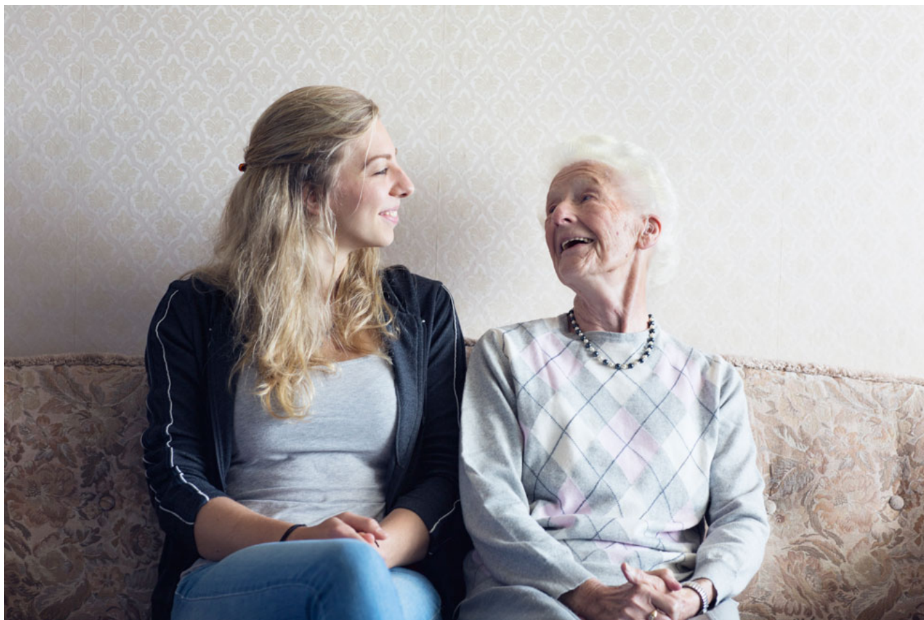
Das Geheimnis eines langen Lebens