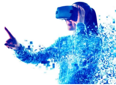
"Wir tun viel, um mehr Frauen zu rekrutieren"