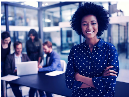
Wie wir die Bedingungen für Gründerinnen in der Schweiz verbessern können