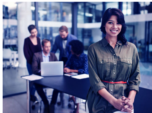
«Chancengleichheit ist eine volkswirtschaftliche Notwendigkeit» - eine Podcast-Episode