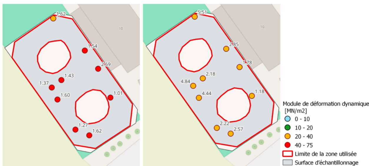
Fig. 1 : Variations spatiales des propriétés de physiologie sportive du sol équestre du site 2 à la semaine 4 (à gauche), par rapport à la semaine 7 (à droite). Les lignes rouges définissent les zones utilisées du sol équestre, surface grise : zone où ont été faites les mesures aléatoires

neuf endroits répartis au hasard sur chacune des dix places. Il a en outre été examiné si l'évaluation complète des courbes de tassement, y compris la vitesse de rebond de la masse tombante du déflectomètre léger, pouvait représenter une méthode objective pour décrire la réactivité d'une surface équestre.