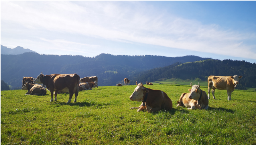
Wiederkäuer nutzen wertvolles Grasland.

https://doi.org/10.34776/afs14-236 Publikationsdatum: 7. Dezember 2023