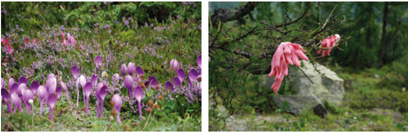
Abbildung 2: Bestimmungsversuche – fotografische Langzeit-Untersuchung seit 2000. Fotografien, Installationen mit diversen Materialien in unterschiedlichen Umgebungen. Abgebildet: lila Plastiklöffel (links) und rosa Gummihandschuhe (rechts) in Pflanzen. Links: Utiligeneraceae calixae , Berg-Schwarmlöffler, Mutationen des calixum albinum ; rechts: Utiligeneraceae purae , Aqua Manus rosa , Fingerling aus der Fam. Scopae purae , Putzlinge (Paraphyten Gletsch, ehemaliges Gletschergebiet). Aus dem Bestimmungsbuch, unveröffentlicht

Als ethnografisch informierte Forschende und bildende Künstlerin untersuche ich in meinem Projekt – und dies wird das Kernstück meiner Dissertation sein –, wie Besuchende der Paranatur Forschungslabore diese ( Para )Naturen im Detail rezipieren, imaginieren und zum Teil auch selbst gestalten. Bei meinem Vorhaben interessiert mich, inwiefern die Idee der Paranatur dazu dienen kann, aktuelle und zukünftige Vorstellungen von sogenannter Natur im Kontext unserer Konsumwelten zu debattieren. Meine Frage basiert auf der These, dass mit sinnlichen Mitteln der Kunst die spezifisch in der westlichen Moderne geprägten Vorstellungen der Trennung von »Natur« und »Kultur« lustvoll überschritten und spekulativ