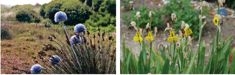
Abbildung 1: Bestimmungsversuche – fotografische Langzeit-Untersuchung seit 2000. Fotografien, Installationen mit diversen Materialien in unterschiedlichen Umgebungen, alle Fotografien © Andrina Jörg. Abgebildet: Staubwedel (links) und Haarspangen (rechts) in Pflanzen. Links: Utiligeneraceae purae , Scopa ultramarina , Blauer Kugelbeserich; rechts: Utiligeneraceae purae , Fibula flava papilio , leuchtender Kneifgreifer. Aus dem Bestimmungsbuch, unveröffentlicht