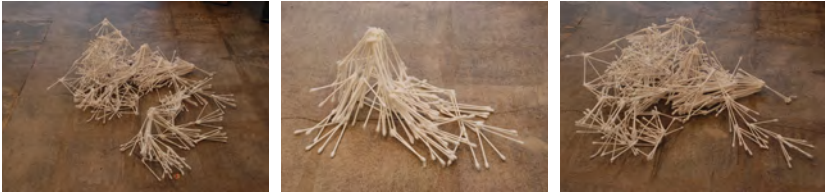
Abbildung 10: Einblick ins temporär eingerichtete Paranatur Forschungslabor im Raum für Kunst im Eck, Ohrenstäbchen geklebt, ca. 30 cm x 60 cm, verschiedene Formationen, Aarau, Oktober 2020