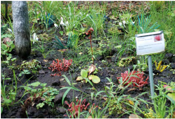
Abbildung 3: Versuchsfeld, temporäre Paranatur-Installation im Park Seleger Moor, Rifferswil, Detailansicht mit Bestimmungstafel, Kabelbinder im Moor, 2016

Das Paranatur Forschungslaboratorium besteht aus einer Reihe situativ inszenierter Paranatur Forschungslabore . Diese habe ich nomadisch und kontextbezogen als ephemere Interventionen/Installationen kreiert. Mit den Laboren schaffe ich Versuchsanordnungen, in denen konkrete Materialien/ Materialgefüge erprobt und verschiedene Wahrnehmungs, Vermittlungs, Erzähl- und Darstellungsmodi erkundet werden. Die Labore bestehen aus Elementen, die die Paranatur darstellen: Objekte, Fotografien, Bestimmungsbücher und tafeln.