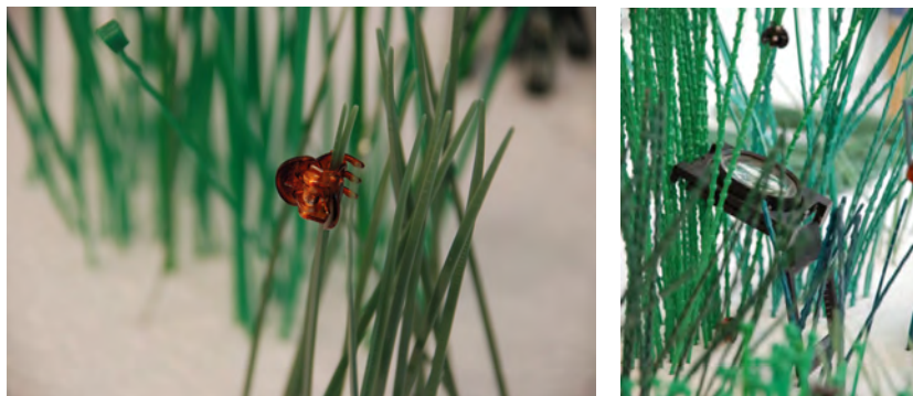
Abbildung 9: Einblick in das temporär eingerichtete Paranatur Forschungslabor im Raum für Kunst im Eck, Kabelbinder-Installation auf Styropor, Detailaufnahmen, Aarau, Oktober 2020

Gerade weil das Wahrgenommene in seiner Mehrdeutigkeit nicht mehr klar zu benennen war, behielten sich die Besuchenden mit sprachlichen Hybridisierungen, um das Neuartige einzuordnen. Sie bildeten zum Teil Neologismen, welche die verschiedenen Weltbezüge in einem neuen Ausdruck vereinten. So sahen die Besuchenden nebst ›Topfbäumen‹ auch ›Federballblüten‹, ›Löffelchenbäume‹ oder ›Gabelsalat‹. Der Phänomenologe Bernhard Waldenfels hat sich im Zusammenhang mit neuen »Ordnungen im Werden«, mit individuellen Ordnungsprozessen und sinnlichen Wahrnehmungen auseinandergesetzt. In der Publikation Sinne und Künste im Wechselspiel – Modi ästhetischer Erfahrung schreibt er: »[Es] stellt sich das Ordnungsgeschehen als Umsetzung und Umwandlung dar. Etwas wird zu etwas, in dem es Form annimmt, sich in Feldern ausbreitet, in Horizonte eintritt und unter wandelnden Umständen wiederkehrt«. Und: