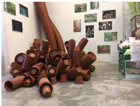
Abbildung 7: Einblick in das temporär eingerichtete Paranatur Forschungslabor im Raum für Kunst im Eck, Blick von der Türe aus, Aarau, Oktober 2020

Wo bin ich da? In einem Labor, wurde mir gesagt // Ich sehe viele Anzeichen von Forschungsinstrumenten, es hat Tabellen, fotografische Aufnahmen, Kühlschränke und Forschungsgegenstände // kistenweise Material, das hier wartet // Ich gehe zuerst zu einer Art chemischem Model, das mir gerade ins Auge gefallen ist // Es ist ein Raum, der mich nicht unbedingt in erster Linie an Kunst erinnert, mehr an einen Handwerker Raum, ein Atelier, es ist ganz vieles hier, es scheint so zufällig hingestellt, jemand hat seine Dinge deponiert und aus diesem Depot sind nachher – in der Nacht ist es lebendig geworden // Ich bin hier in einer ganz wunderlichen Welt, die hat etwas Organisches und auch etwas Künstliches // Schwierig, was ich hier wahrnehme, ich nehme etwas extrem Unnatürliches extrem naturnah wahr // Ja, ich bin hier im Treibhaus, mit Pflanzen um mich herum, große Farbenpracht // Ich sehe jetzt wie die Installation gewachsen ist // dass es ganz viele Dinge hat, die eine Ordnung haben, oder ein Durcheinander, je nach dem // Einfache Alltagsgegenstände, die geordnet