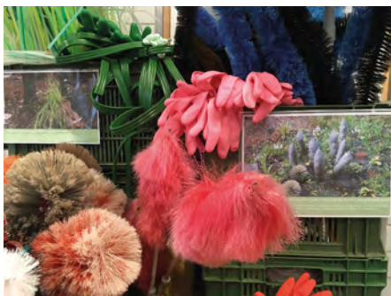
Abbildung 8: Einblick in das temporär eingerichtete Paranatur Forschungslabor im Raum für Kunst im Eck, Gartenkisten, Handschuhe, Staubwedel, Heizungsrohrbürsten, Schlauch, Trinkhalme, Detailaufnahme, Aarau, Oktober 2020

sind, die einen Ausdruck geben, bei dem man das Gefühl hat, man ist in einem verwunschenen Garten.