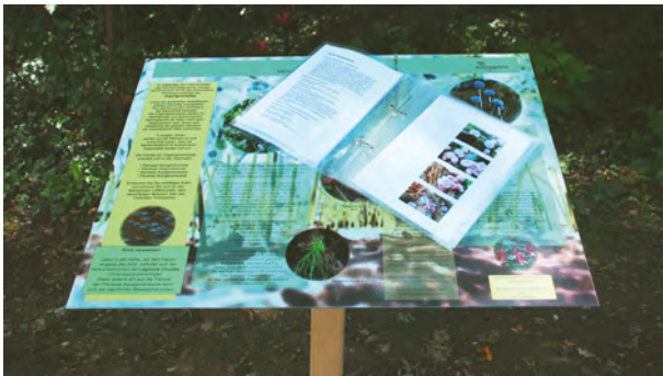
Abbildung 4: Implantea, temporäre Installation im Park des Kantonsspitals Aarau, Detailansicht mit Bestimmungstafel und Bestimmungsbuch, 2011