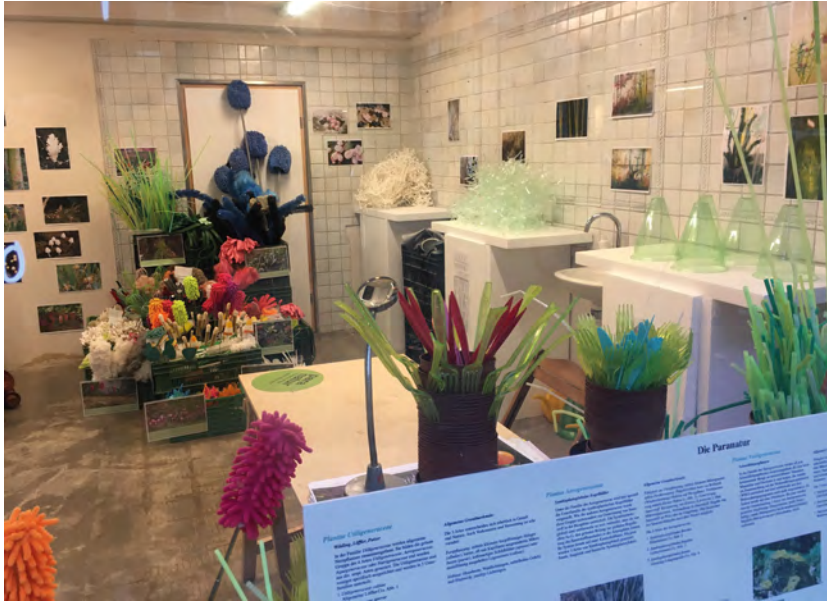
Abbildung 6: Einblick in das temporär eingerichtete Paranatur Forschungslabor im Raum für Kunst im Eck, Blick durch das Schaufenster, Aarau, Oktober 2020

in ein paranatürliches respektive paraflorales Material-Gefüge , das zwischen Forschungslabor und Gärtnerei changierte.