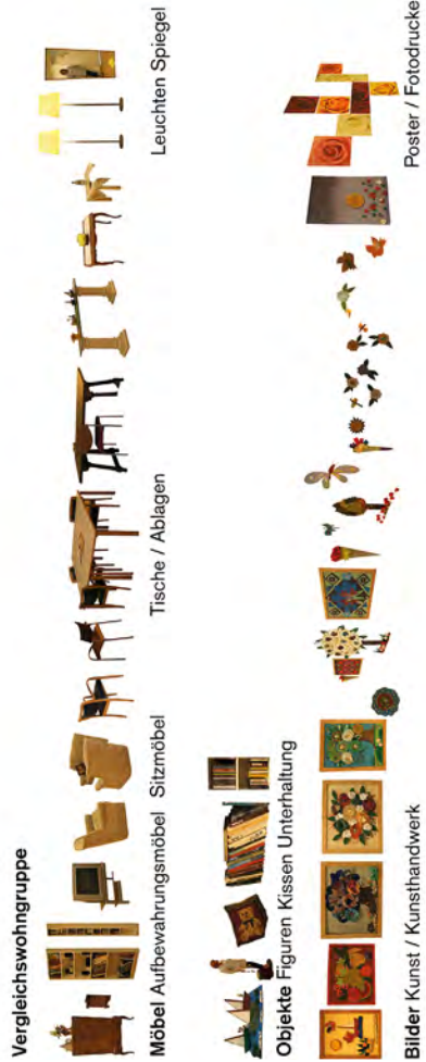
Abbildung 1: Visuelle Analyse der Artefakte in den gemeinschaftlich genutzten Bereichen, Darstellung: Minou Afzali, aus: Afzali: Zur Rolle des Designs in kulturspezifischen Alters- und Pflegeeinrichtungen, S. 90