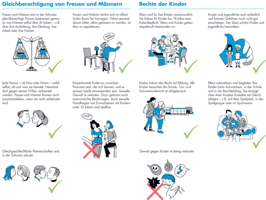
Abbildung 1: «Benimm-Flyer» für Asylsuchende des Kantons Luzern