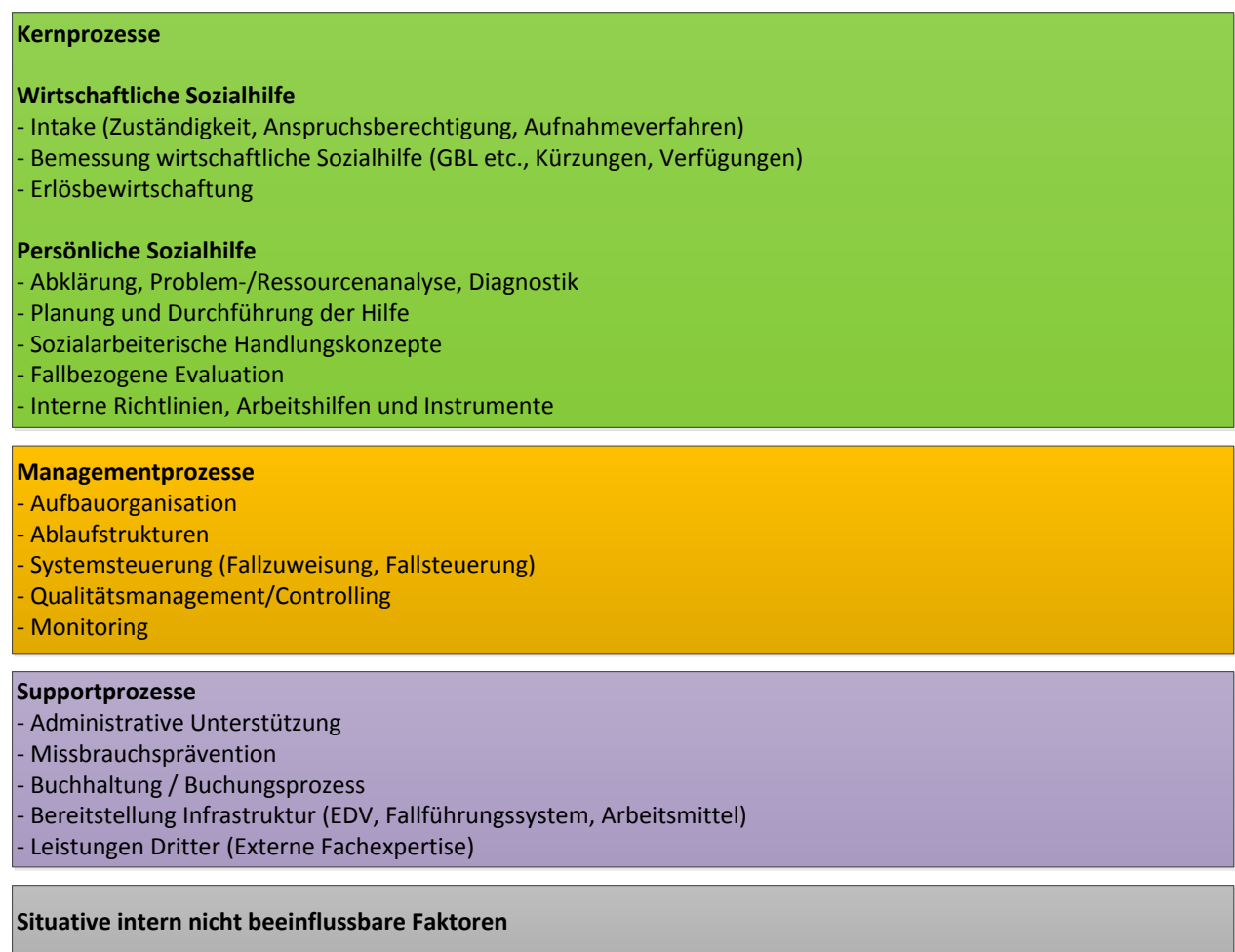
Abbildung 6: Fokusbereiche und Indikatoren der QLS-Onlinebefragung

Das Indikatorenset basiert auf grundlegenden Annahmen aus der Organisationstheorie (Schneider et al., 2011; Rüegg-Stürm, 2003; Preis 2010) sowie langjährigen Projekterfahrungen der Berner Fachhochschule, Fachbereich Soziale Arbeit. Die einzelnen Indikatoren wurden von der BFH in Zusammenarbeit mit Vertretern der Gesundheits- und Fürsorgedirektion des Kantons Bern (GEF) sowie mit Sozialdienstleitenden entwickelt. Die QLS-Onlinebefragung wurde dann mittels Items operationalisiert. Items sind Aussagen über die Prozesse des Sozialdienstes, zu denen die Befragten Zustimmung oder Ablehnung in vorgegebenen Abstufungen äussern können. Die Antworten der Mitarbeitenden werden aggregiert und auf Ebene Sozialdienst ausgewertet. Insgesamt wurden für die befragten Sozialdienst 55 Indikatoren berechnet und fünf Fokusbereichen zugeordnet (vgl. Abbildung 5; vgl. Anhang 1).