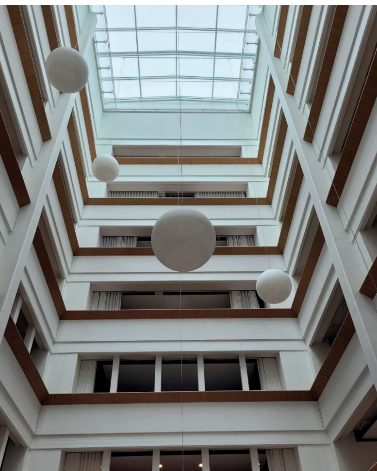
Im Klybeck-Areal studieren insgesamt 71 angehende Pfleger*innen und 153 zukünftige Physiotherapeut*innen.

Neben dem Bachelor-Studium in Physiotherapie bietet das Departement Gesundheit der Berner Fachhochschule seit Herbst 2021 auch das Bachelor-Studium in Pflege in Basel an. Am neuen Standort im Klybeck-Areal studieren aktuell 224 Personen.