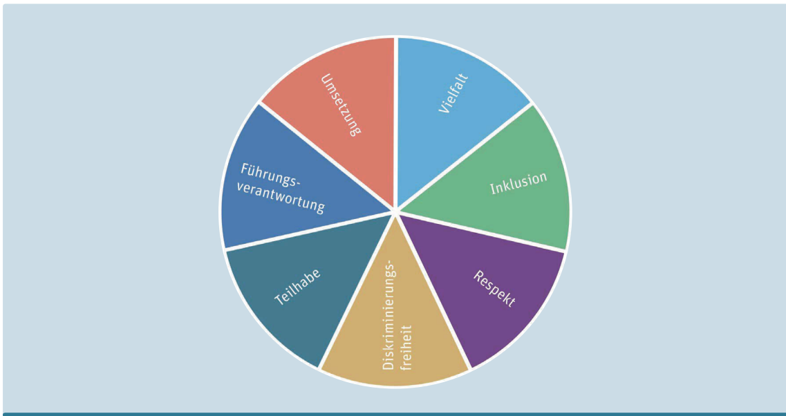
In der Diversity Policy der BFH sind ethische Grundhaltungen im Umgang mit Diversität festgehalten.

schiedlichen Formen wie Beleidigungen, Beschimpfungen, Ausgrenzung, Ignorieren oder sogar physischer Gewalt äussern. Viele LGBTIQ*-Menschen machen solche Erfahrungen in ihrem Leben. Leider sind davon öffentliche Einrichtungen wie Schulen, Ämter, Polizei oder Gesundheitseinrichtungen nicht ausgenommen. Erlebnisse dieser Art können sich bei betroffenen Personen negativ auf die Fähigkeit auswirken, ihre psychische und physische Gesundheit aufrechtzuerhalten (Meyer, 2003). Nicht selten resultiert daraus ein erhöhtes Risikoverhalten beispielsweise beim Alkohol- oder Substanzkonsum. Selbstverletzungen und Suizidalität nehmen zu und sind im Vergleich zu heterosexuellen Menschen deutlich höher (Smalley et al., 2018). Dies trifft insbesondere auf Jugendliche und junge Erwachsene zu (Garcia Nuñez et al., 2022).