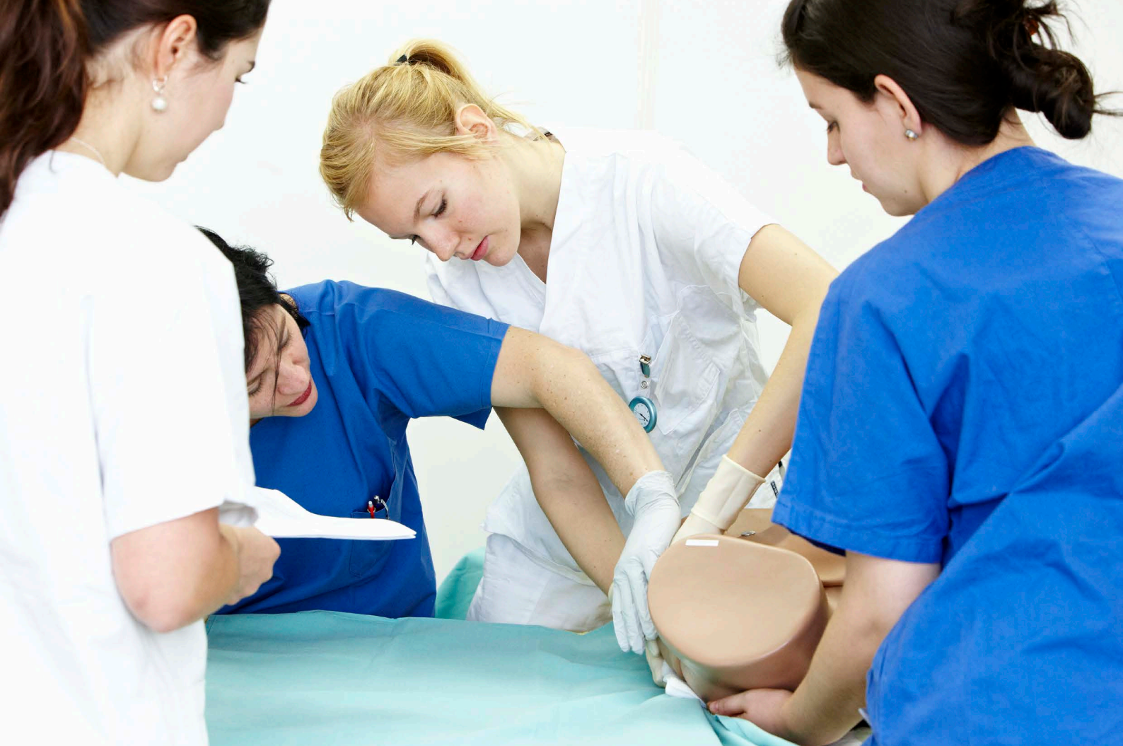
Beim Skills-Training vermitteln zukünftige Hebammen ihr Fachwissen an Medizinstudierende.