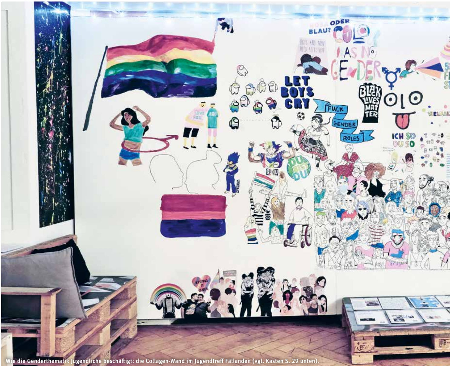
Wie die Genderthematik Jugendliche beschäftigt: die Collagen-Wand im Jugendtreff Fällanden (vgl. Kasten S. 29 unten).