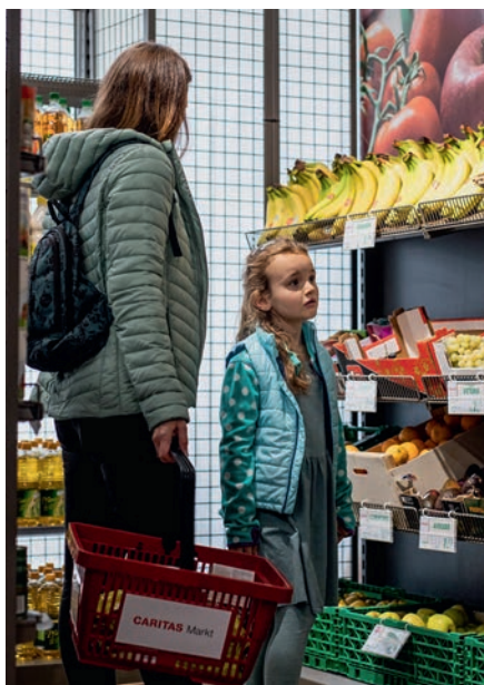
Viele Haushalte leben nur knapp über der Armutsgrenze.