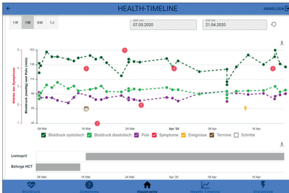
In der Health-Timeline-App werden sämtliche Messwerte, Symptome und Ereignisse übersichtlich dargestellt.