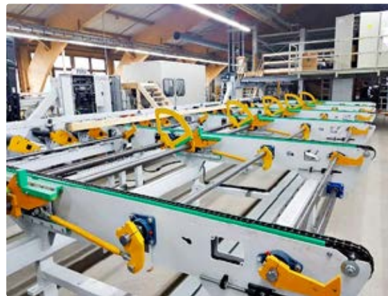
Parallel zu den Forschungsarbeiten hat die Fagus Suisse SA im jurassischen Les Breuleux das Produktionswerk aufgebaut.