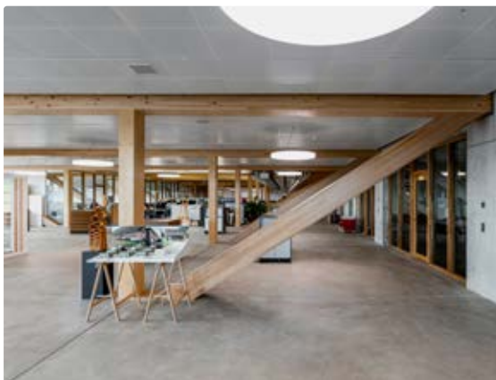
Der Trend zu filigranen Strukturen fordert höhere Tragfähigkeit von Holz. Buchenstabschichtholz bietet Hand.

Weil die Länge des Rohmaterials begrenzt ist, müssen Bretter in einem Brettschichtholzträger gestossen werden. Im Gegensatz zum Brettschichtholz sind bei hochfestem Stabschichtholz diese Stösse kontrolliert und versetzt angeordnet. Damit wird der negative Einfluss der Stösse auf die Festigkeit auf ein Minimum reduziert, und es können höhere Festigkeiten garantiert werden. Ein grosser Vorteil von Brettschichtholz ist der sogenannte Lamellierungseffekt, der zu einer Homogenisierung der Eigenschaften führt und gleichzeitig die Grösse einzelner Holzmerkmale limitiert. Beim Stabschichtholz wird dieser Effekt sogar in zwei Richtungen ausgenutzt. Zusätzlich bewirkt diese zweifache Lamellierung, dass das benötigte Rohmaterial einen kleineren Querschnitt hat. Dies bringt eine höhere Ausbeute bei höheren Festigkeiten.