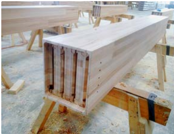
Stabschichtholz: höhere Ausbeute beim Rohmaterial und höhere Festigkeiten