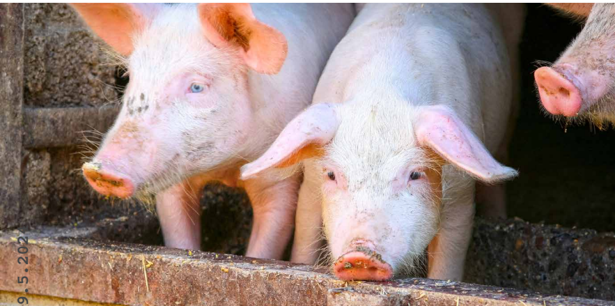
Schweine sind wichtige Verwerter von Lebensmittel-Nebenprodukten.

https://doi.org/10.34776/afs11-238 Publikationsdatum: 24. November 2020