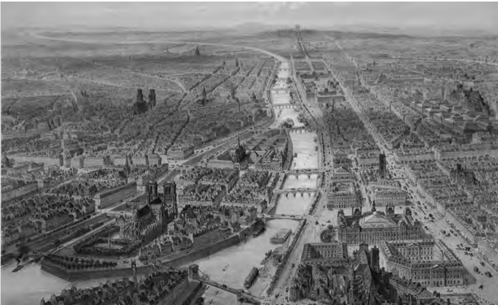
ABBILDUNG 2 UND 3 Zwischen 1830 und 1860 schärfte sich das Bewusstsein für die Großstadt Paris in einem zuvor ungeahnten Ausmaß und fand hierfür in sämtlichen Künsten neue Ausdrucksmittel. Die beiden ›Vues de Paris à vol d'oiseau‹ verdeutlichen anschaulich, wie sich der Blick weitert und dabei ebenso um Detailgenauigkeit bemüht ist, zumal ab der Jahrhundertmitte hierfür auch fotografische Verfahren unterstützend herangezogen werden konnten. Oben: »Paris à vol d'oiseau, M DCCC LII«, aus: Edmond Auguste Texier: Tableau de Paris. Ouvrage illustré de quinze cents gravures , Paris 1852/53, unten: »Vue à vol d'oiseau prise au dessus du quartier St. Gervais« aus: Paris dans sa splendeur. Monuments, vues, scènes historiques, descriptions et histoire. Dessins et lithographies (avec l'aide de la photographie) , Paris 1861