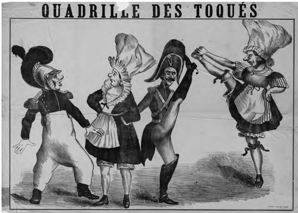
ABBILDUNG 1 Quadrille des Toqués (Quadrille der Verrückten). Zahlreiche Abbildungen, die Szenen der Pariser Dansomanie aufgreifen, darunter insbesondere Karikaturen und Grafiken aus dem Umfeld der ›Rigolbochomanie‹, das heißt früher Cancan-Praktiken, belegen die Begeisterung für hohe Beinschwünge, die selbstverständlich entsprechende Exercises erforderten. Während man diese Übungen ebenso wie die Beinschwünge selbst im urbanen Kontext nicht ohne Skepsis beobachtete, gehörten sie im Theater – als Vorbereitungen für Grands Battements und Développés, ebenso den Halt von Attitüden und Arabesken – zum Repertoire des professionellen Ballettrainings.

politisch motiviert und wurden auch vornehmlich von Männern, insbesondere einfachen Handwerkern und Soldaten praktiziert. Erst später, durch die Migration dieser Tanzform in das Stadttinnere, gleichzeitig ihre stilistische Ausformung und Etablierung durch die Damen der urbanen Tanzszene – allen voran ›ces dames‹ der Demi-Monde – avancierten sie zu einem erfolversprechenden Moment teuflischer Versuchungen. 14 Und während sowohl Opéras comiques als auch Opéras bouffes vergleichsweise direkt auf solche jüngeren Errungenschaften des städtischen Tanztreibens Bezug nahmen – sei es auch nur hör- und nicht sichtbar, das heißt allein musikalisch, jedoch nicht zwangsläufig choreografisch umgesetzt –, wurden in den Grands opéras vergleichbare Anspielungen, um deren durchschlagende Wirkung man nur zu genau wusste, betont dezent, daher umso effektreicher und aufwendig inszeniert kaschiert.