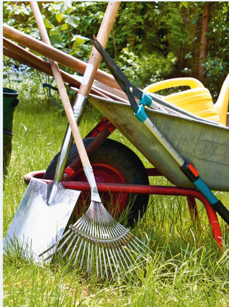
Dem Befähigungsansatz liegt das Gleichnis der drei Gärtner zugrunde.

Schliesslich sind auch kulturelle Werte und Normen der regionalen Bevölkerung von Bedeutung, wenn es um den Zugang zu gesellschaftlichen Positionen geht. Gewisse unveränderliche Merkmale einer Person beeinflussen, wie sie von der Gesellschaft wahrgenommen wird und welche Eigenschaften ihr dadurch zugeschrieben werden. Dies sind beispielsweise Jahrgang, Herkunft und Geschlecht.