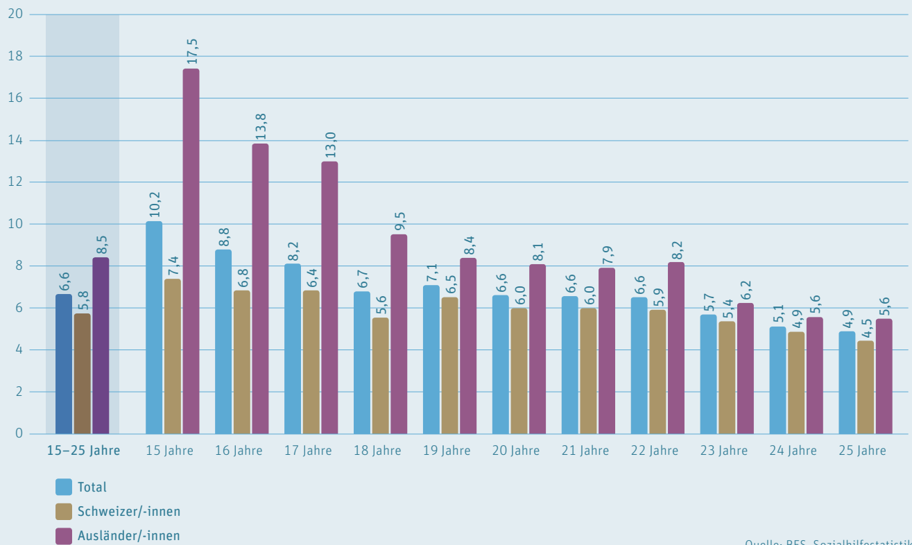
Grafik 1: Sozialhilfequoten nach Altersjahren (15–25) und Nationalität 2017 (in 14 Städten)

Wie Grafik 1 verdeutlicht, nimmt das Sozialhilferisiko von Jugendlichen und jungen Erwachsenen mit zunehmendem Alter stark ab. Im Durchschnitt ist das Sozialhilferisiko der 15-Jährigen doppelt so hoch, wie dasjenige der 25-Jährigen. Bei ausländischen 15-Jährigen ist das Sozialhilferisiko sogar mehr als drei Mal höher als das ausländischer 25-Jähriger. Ausländische Jugendliche wachsen viel häufiger in einer Familie auf, die auf Sozialhilfe angewiesen ist. Bei den ausländischen 25-Jährigen ist das Sozialhilferisiko nur noch geringfügig höher als das der gleichaltrigen Schweizerinnen und Schweizern.